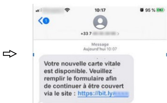
Exemple d'un SMS frauduleux incitant à cliquer sur un lien pour renouveler sa carte Vitale.

Les nombreux témoignages recensés par nos services ou nos associations locales attestent également d'un phénomène prolifique.